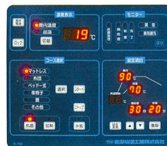
キーシート操作パネル